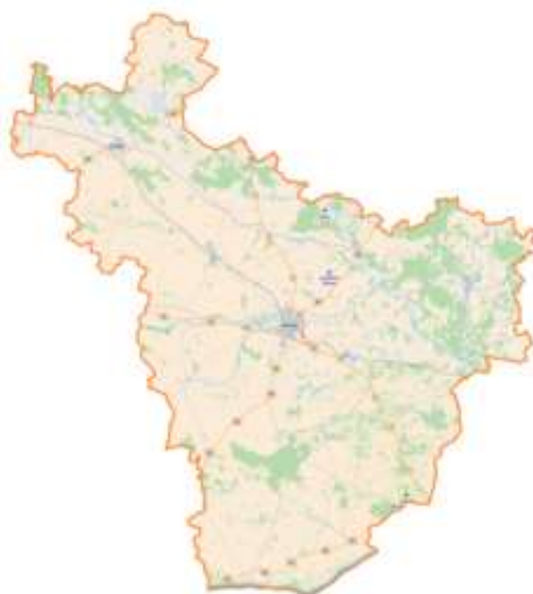
Rysunek 1. Gmina Płońsk na tle powiatu płońskiego

Miasto Płońsk – miasto w województwie mazowieckim, w powiecie płońskim. Miasto ma obszar 11,6 km 2 .