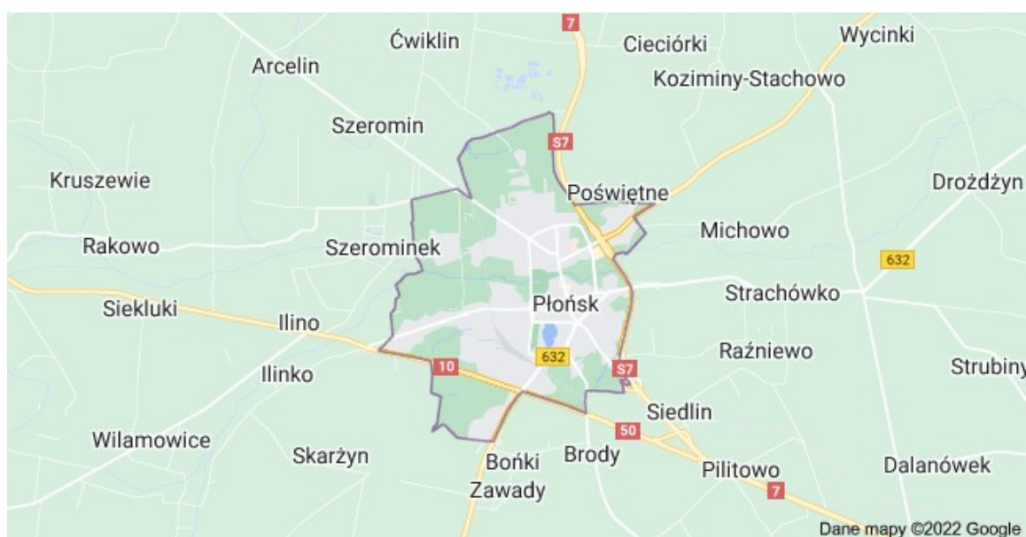
Rysunek 2. Mapa miasta Płońsk

Kierowcy korzystają już z zachodniej obwodnicy Płońska. Została wybudowana jako część wielomilionowego projektu „Budowa ścieżek rowerowych w ramach działania ograniczenie zanieczyszczeń powietrza i rozwój mobilności miejskiej”. W ramach inwestycji powstały m.in. obwodnica centrum miasta, 2-kilometrowa obwodnica zachodnia, 2 ronda i most na rzece Płonka. Ponadto wybudowane zostały ścieżki rowerowe, chodniki i oświetlenie uliczne. Miasto wzbogaciło się o dwa miejskie autobusy i parkingi typu parkuj i jedź. Jest też system inteligentnego transportu.